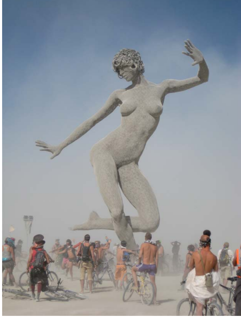
Burning Man, 2010.

Men kender du dine værdier? Og er du bevidst om, hvordan de forandrer sig i takt med dine behov og din udvikling som menneske? Måske er spænding og dynamik vigtigt for dig i en periode, hvorimod ro og velvære presser sig på i en anden. Og lytter du ikke til din indre stemme, så lever du ikke i integritet med dig selv og kan opleve stress og en nagende utilfredshed med livet. Så gør noget ved det!